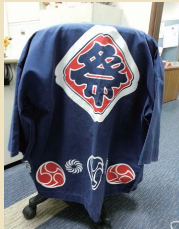
JAS Loan_Dark Blue Happi-Back