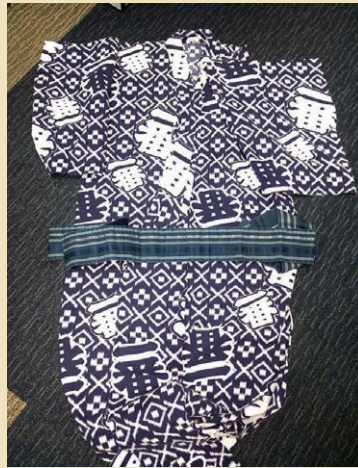
JAS Men Yukata