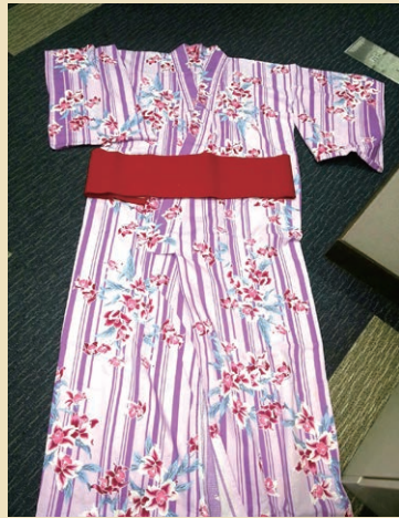
JAS Ladies Yukata