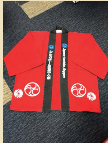
JAS Loan_Red Happi Front