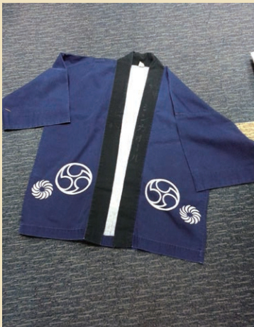
JAS Loan_Dark Blue Happi-Front