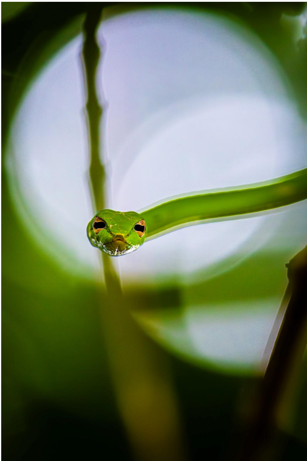
作品名： 「Good morning Mr Snake」 撮影場所： Sungei Buloh Wetland Reserve コメント： Careful where you step 部門： シンガポール魅力部門