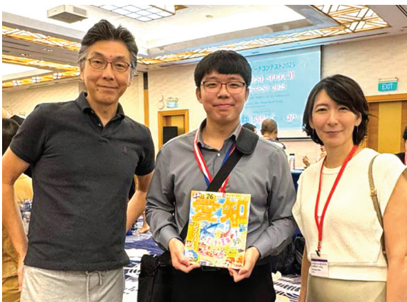
スピーチコンテスト後の懇親会にて

The main message I wanted to share in my speech — something I probably repeated several times during the speech — is “Don't be afraid to take the first step.” Of course, the first step is something that is scary for me, and I am sure it can feel the same for many of us. But I have realised that this fear often originates from the pressure or the heavy expectations that we place on ourselves. The moment you recognise that, something inside you clicks into place. That was the experience I wanted to share in particular. Because once you take that first step, it is as though a door opens and a new path appears before you.