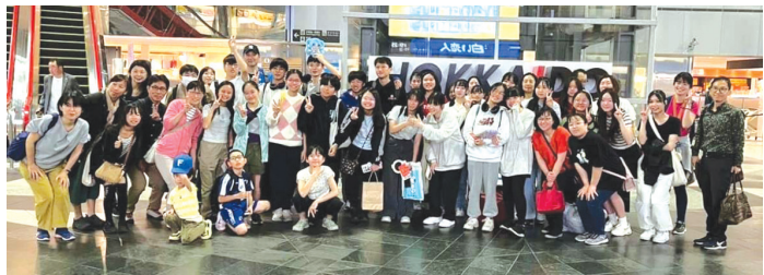
シンガポール団体と札幌団体の記念撮影