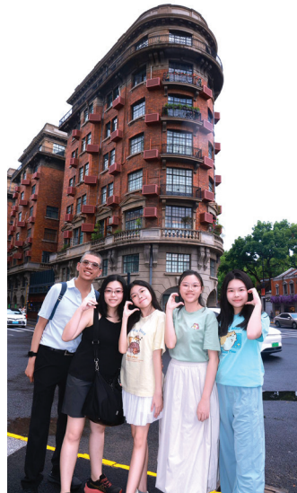
中国にて大好きな家族と撮影