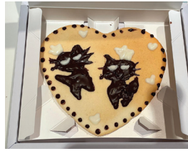
白い恋人パークで作った パティへのクッキー

を食べたりしました。それに、友達と一緒に札幌の有名な場所に行って、日本語を練習ながらいい思い出を作りました。その2週間は、人生で最も楽しい時間の一つでした。日本語を勉強していなければ、このようなチャンスはなかったと思います。