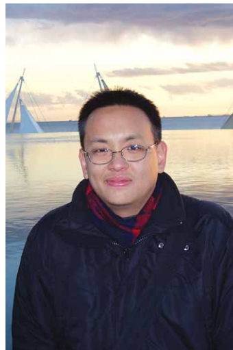
日本中を旅して回った学生時代