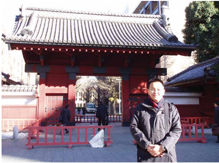
6年間通った東大の赤門で