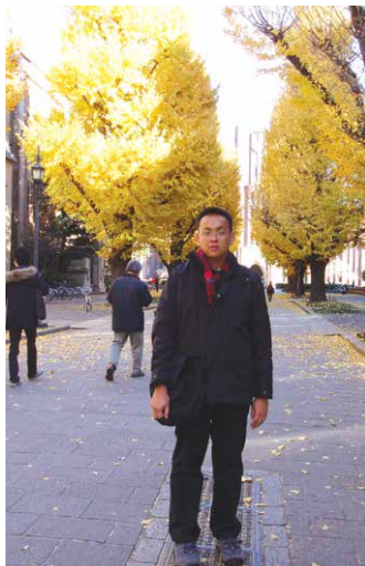
東大キャンパスの銀杏並木