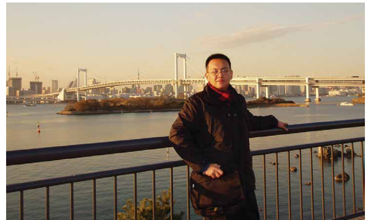
レインボーブリッジをバックに