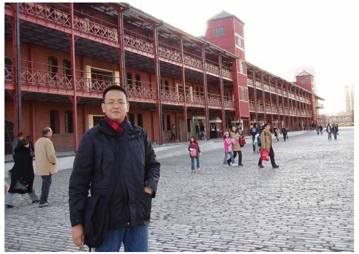
横浜の赤レンガ倉庫にて

大阪では友人のホストファミリーのお父さんが喋るきれいな関西弁を聞いて、「美しい言葉なんだな」と感心したことも印象に残っています。