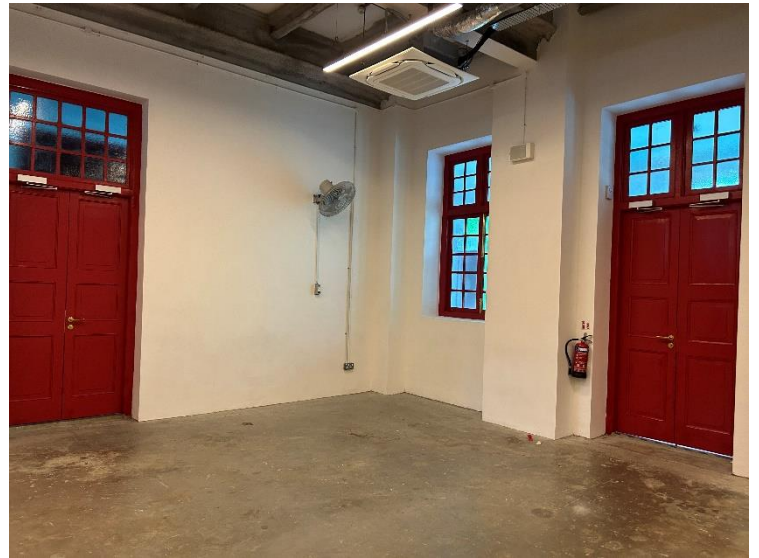
こちらは2階の教室です。

現在のスタンフォードアートセンターは近代的な装飾が施されており、1921年に日本人小学校が建てられた当時の装飾は全て撤去されているそうです。そのため、桜のモチーフの木製パネルに似たものは残されていません。