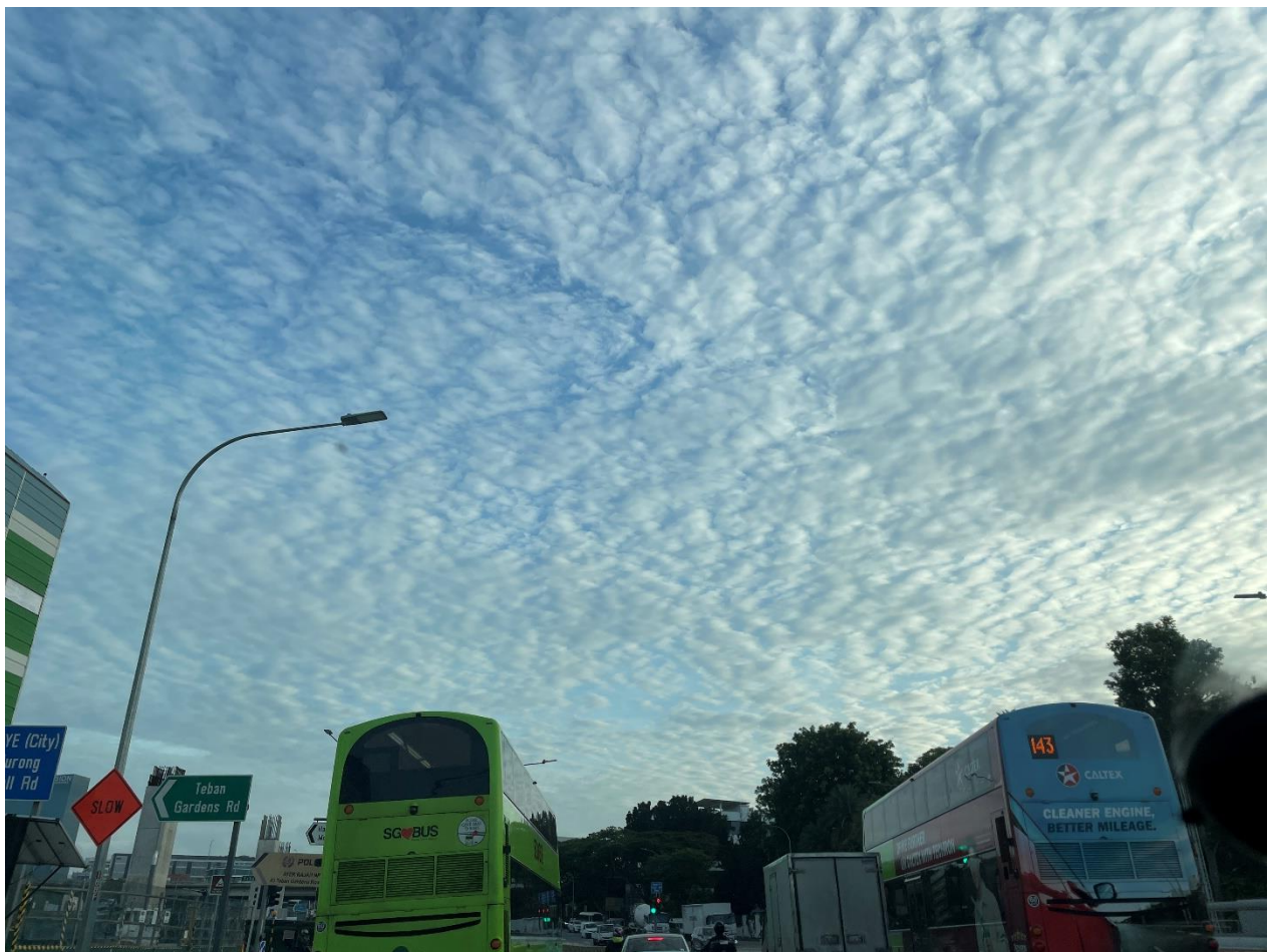
作品名：「UROKO」 撮影場所：Pandan garden コメント：あめのよかん。 部門：一般の部