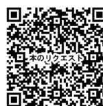
購入希望 図書リクエスト

E-ライブラリー（図書検索）では、ご家族の現在の図書貸し出し状況や、蔵書検索をすることができます。