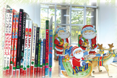
季節に合わせた本のシリーズコーナー