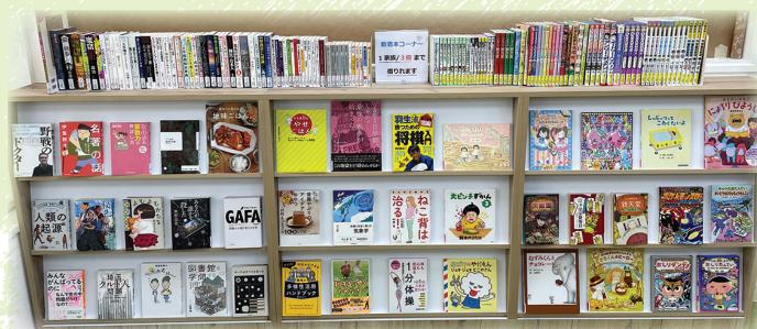
新着本コーナーの本棚（1世帯3冊まで借りられます）