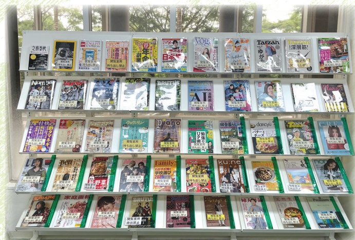
表紙が見やすく並んだコミックルームの雑誌コーナー