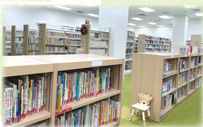
手前に絵本、奥に一般書籍を配架した本棚

日本人会のリノベーションのコンセプトは「土・水・木」ですが、図書室はそのコンセプトを尊重し、自然を感じ、緑あふれる森の中にいながら本を読む・選ぶということができる空間をイメージしています。