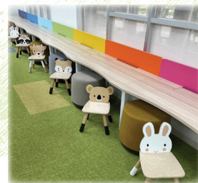
どうぶつ柄の椅子