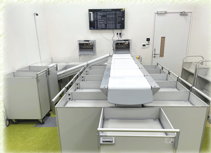
返却本を自動仕分けするベルトコンベアー