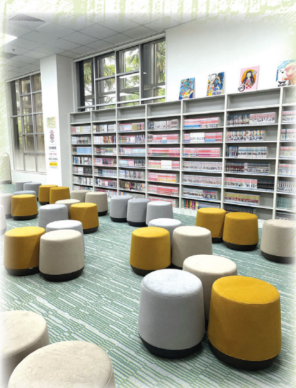
豊富なコミックと落ち着いた空間のコミックルーム