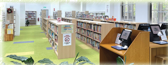
より快適になった新図書室