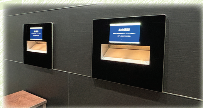
図書室入り口の左手側にある返却ポスト