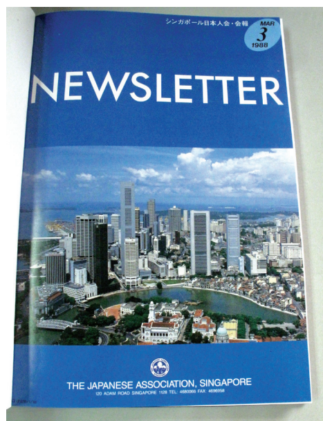
ニュースレター創刊号 The first issue of the newsletter