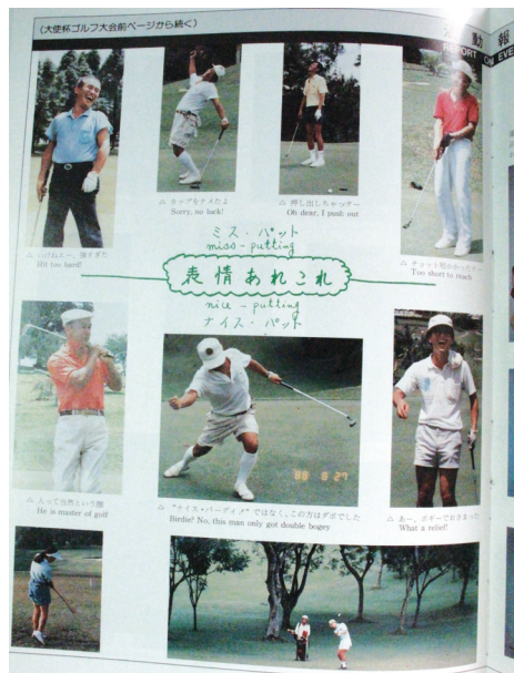
ニュースレター創刊当時、 手作りのレイアウトでした。 When the newsletter was first published, the layout was done by hand.