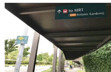
バス停から歩道橋用エレベーターへの道 Sheltered walkway to overhead bridge (with lift access)