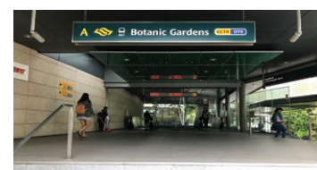
Botanic Gardens MRT駅

乗車料金：一律片道 $1.50【6歳未満のお子様は無料 Free for children below 6 years old.】