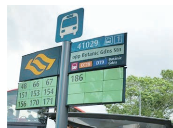
Opp Botanic Gardens Stn バス停番号 41029