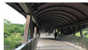
Botanic Gardens MRTへ 歩道橋 Overhead bridge