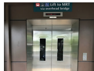
歩道橋用エレベーター Lift to MRT via overhead bridge