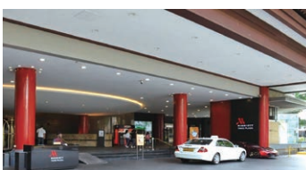
Singapore Marriott Tang Plaza Hotel 正面玄関 シンガポール日本人会シャトルバス乗降場所

スマートフォンとPCからシャトルバスの現在地が確認できます。Beeline SG (T02) をご利用ください。 Please check Beeline SG (T02) for bus location.